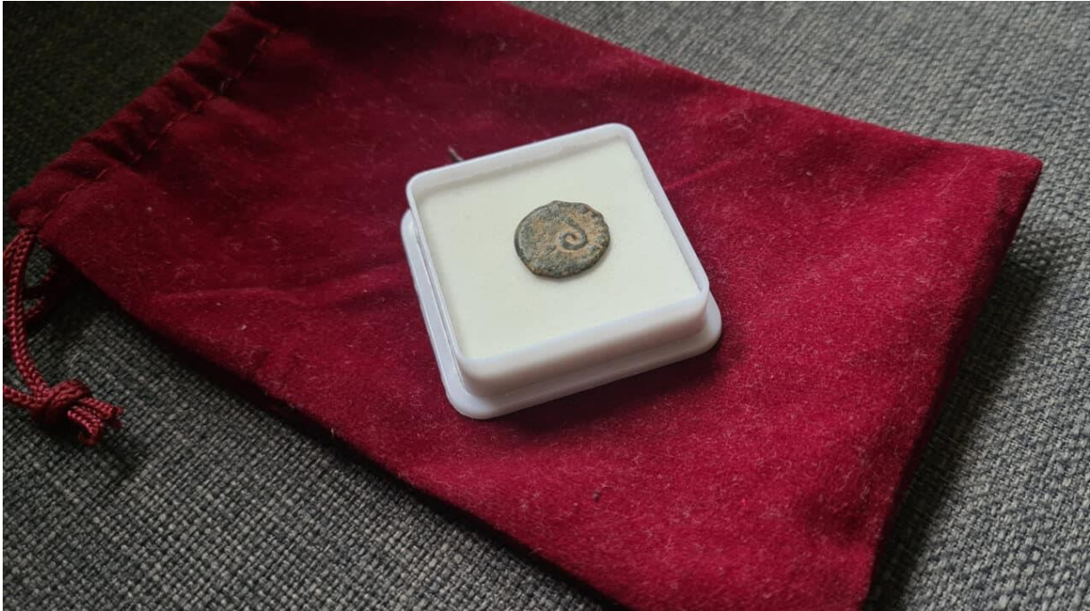
Pilatus-Münze, 26–36 n. Chr.

Es geht in der Sache mit Pilatus eben genau darum: Unser Glaube baut nicht auf Märchen und Sagen, sondern ist vielmehr verankert im Handeln Gottes in der Geschichte.