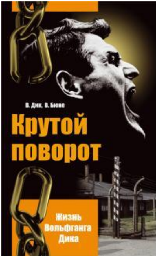
Das evangelistische Verteilbuch „Vom Knast zur Kanzel“ oben in der russischen Übersetzung