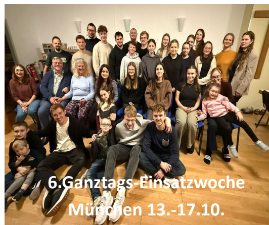
6. Ganztags-Einsatzwoche München 13.-17.10.